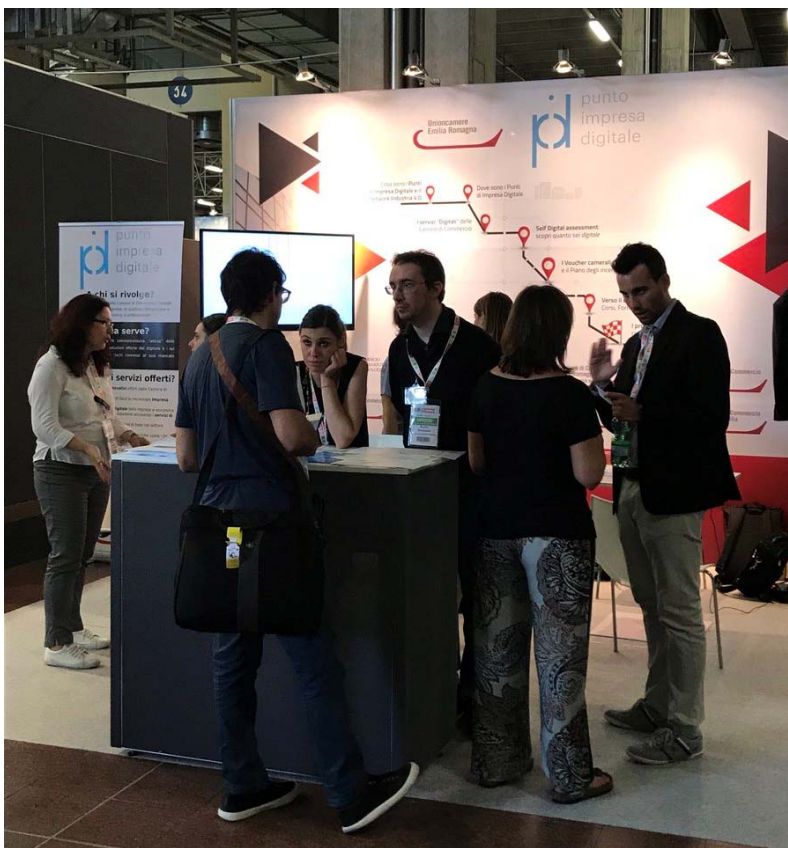
Lo stand del Punto Impresa Digitale di Modena alla fiera R2B di Bologna

Tutti gli aggiornamenti verranno pubblicati tempestivamente sul sito camerale nella pagina dedicata al PID.